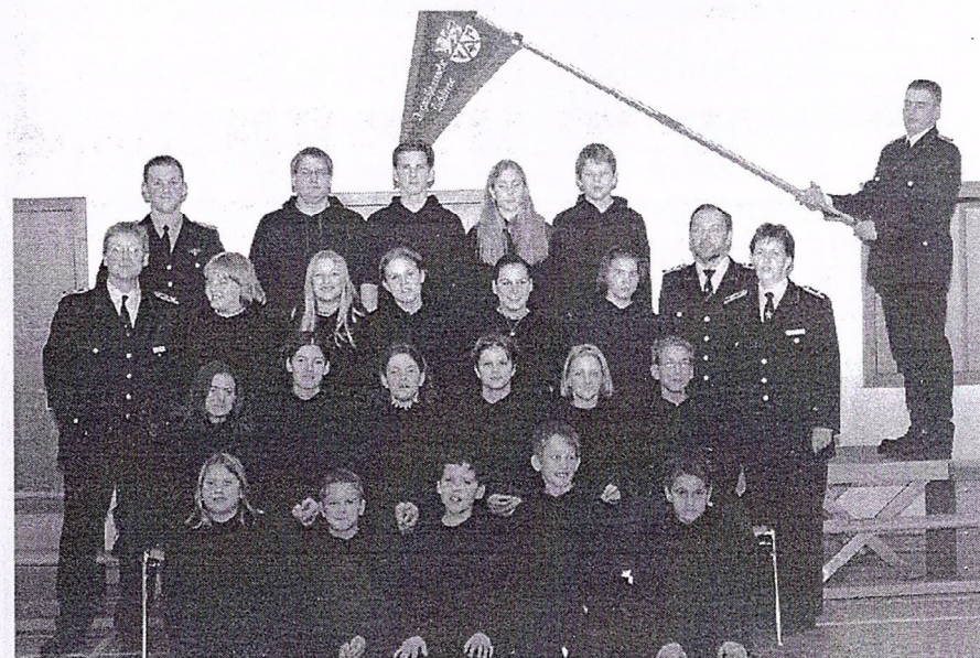
Unsere Jugendfeuerwehr in Didderse zum Jubiläumsjahr 2000

Heute besteht die Jugendfeuerwehr Didderse aus 15 Mädchen und 12 Jungen. Bei den vielen Aktivitäten erhalten die Leiter der Jugendfeuerwehr starke Unterstützung von den Familien, Kameraden und Eltern ihrer Mitglieder, die reges Interesse an der Jugendfeuerwehr zeigen.