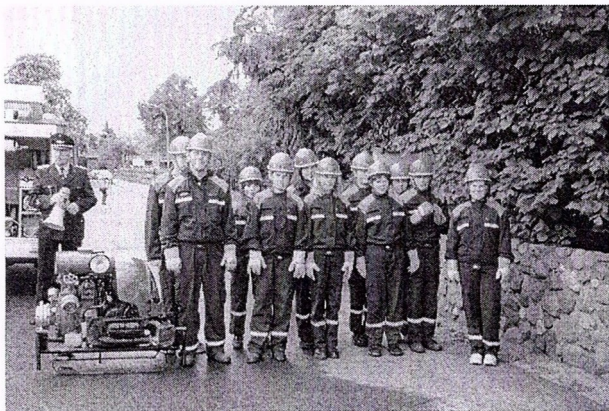
Löschvorführung zum 5jährigen Bestehen der Jugendfeuerwehr Didderse am 24.10.1997