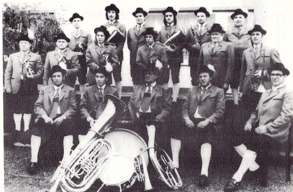
Der Feuerwehrmusikzug in Trachten