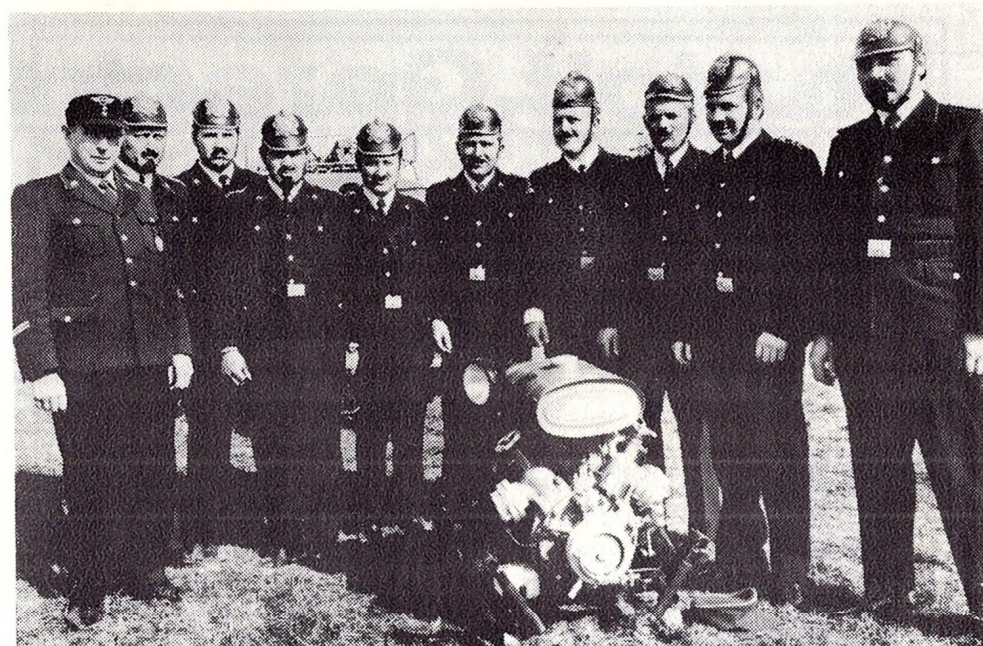
Die I. Wettkampfgruppe in "Veteranenmontur"